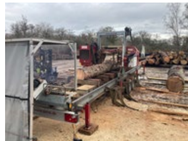
Scierie mobile (debit de l'agrume)

Notre bâtiment, construit avec fierté en bois français , met en avant la robustesse du chêne pour les poteaux, la solidité du pin sylvestre pour les solives des planchers, et le caractère naturel du bois également utilisé pour les façades.