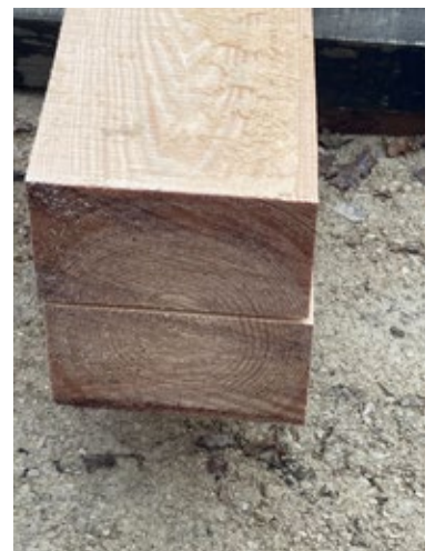
Poutre en Pin (laricio)