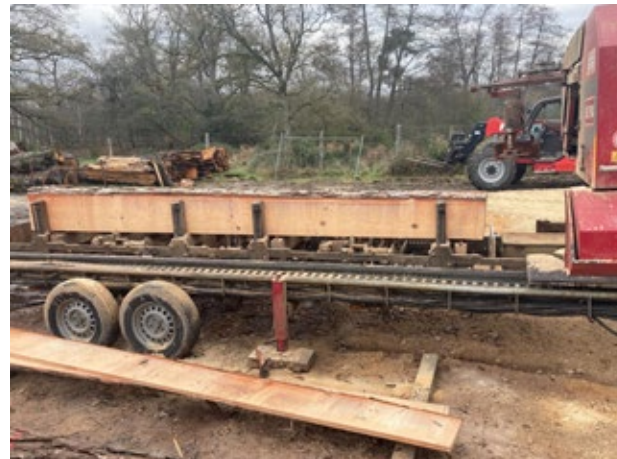
Scierie mobile (debit de l'agrume)

Cette approche assure une construction durable, contribuant à la réduction de l'empreinte carbone et au respect de l'environnement , tout en assurant une totale traçabilité du bois. Le chêne pour les poteaux, le pin sylvestre pour les solives des planchers, proviennent spécifiquement du Domaine de Chambord , ajoutant une dimension locale et patrimonial à notre engagement écologique.