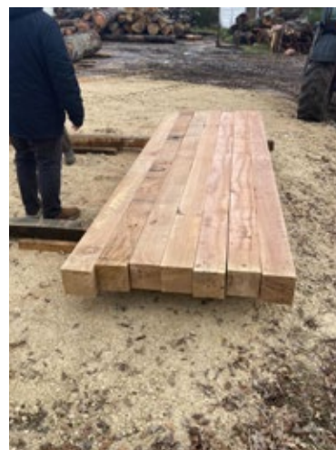
Poteaux en Chêne