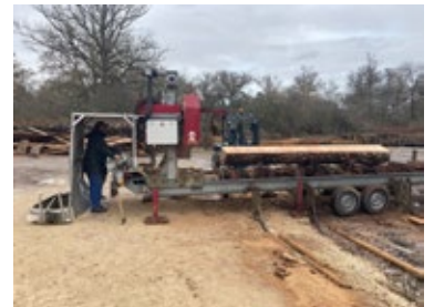
Scierie mobile (debit de l'agrume)