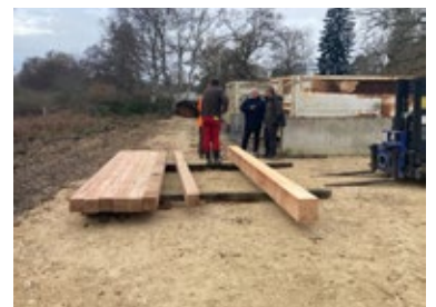
Poutre en Pin (laricio)